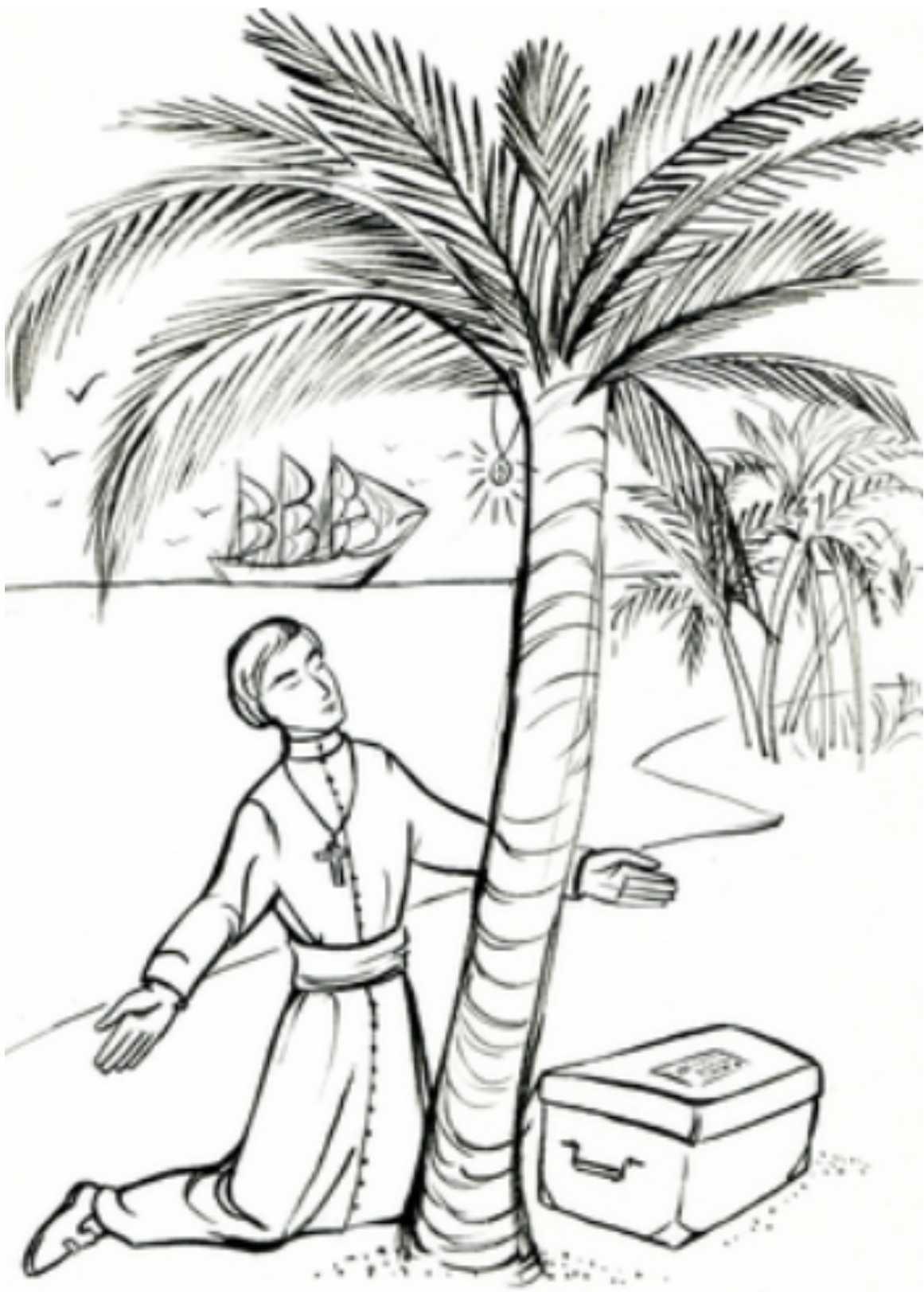
Saint Pierre Chanel, saint Bressan, à la rencontre des Wallisiens