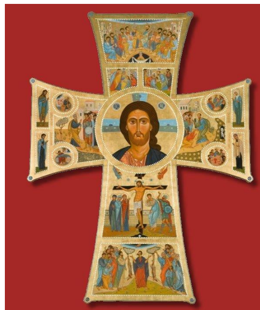
(Croix de l'Esprit Saint, CUET)

Vivre le message de Jésus, c'est pourtant des gestes tout simples qui ne font pas de bruits